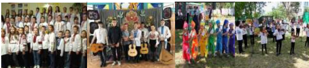
ПМШМ «Мала академія мистецтв» імені Раїси Кириченко

З метою підвищення виконавської майстерності учнів і викладачів в школах активно працюють художні та творчі колективи. Протягом навчального року учні брали активну участь в обласних, всеукраїнських і міжнародних фестивалях і конкурсах, численних благодійних акціях і заходах.