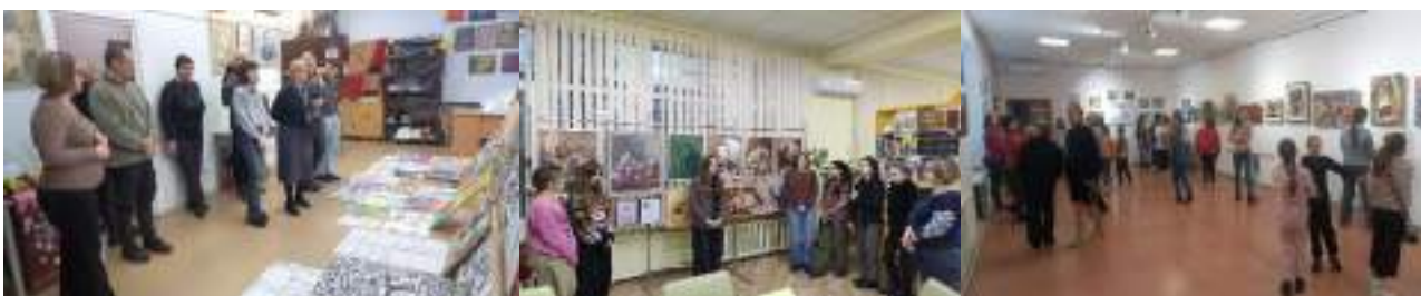
Полтавська дитяча художня школа ім. С.Пашинського