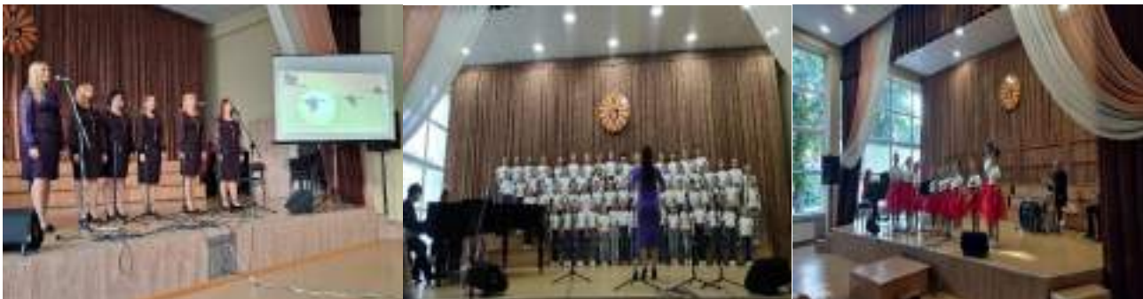
Полтавська дитяча музична школа №3 ім. Б.Гмирі

Впродовж року викладачами шкіл велася вагома методична робота: відкриті уроки, семінарські заняття, педагогічні читання, методичні доповіді, циклові комісії, шкільні олімпіади. Викладачі брали участь у вебінарах, онлайн-засіданнях методичних об'єднань, науково-практичних конференціях тощо.