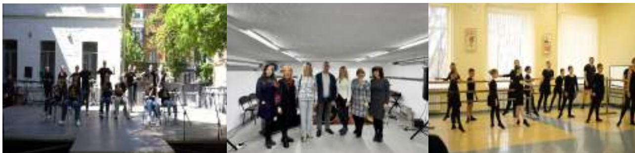
Полтавська дитяча музична школа №1 ім. П.І.Майбороди

З метою підвищення виконавської майстерності учнів і викладачів в школах активно працюють художні та творчі колективи. Протягом навчального року учні брали активну участь в обласних, всеукраїнських і міжнародних фестивалях і конкурсах, численних благодійних акціях і заходах.