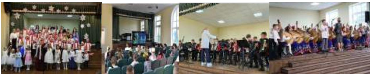
Полтавська дитяча музична школа №2 ім. В.П.Шаповаленка

У травні-червні 2024 року проведені випускні та урочисті церемонії вручення свідоцтв про закінчення закладу освіти в сфері культури.